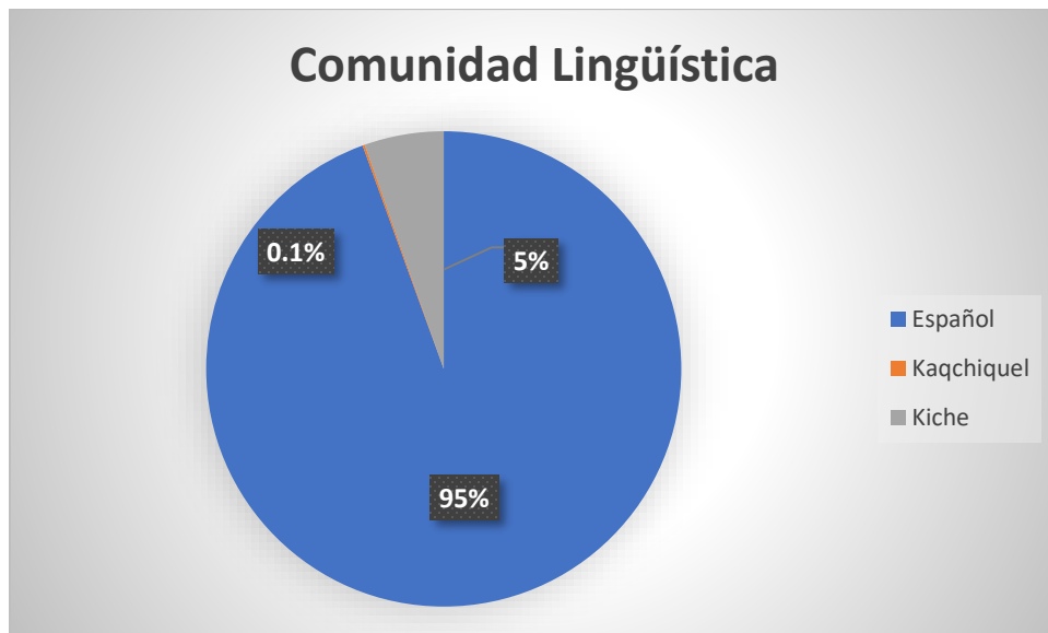
Grafica No. 2 Frecuencia Según Comunidad Lingüística