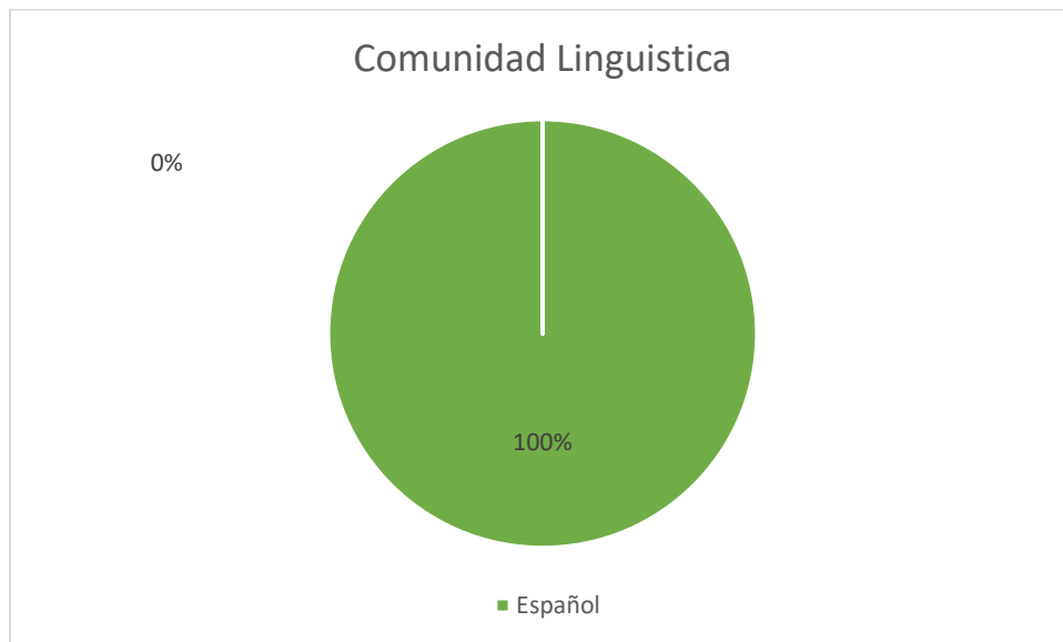
Grafica No. 2 Frecuencia Según Comunidad Lingüística