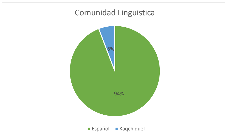
Grafica No. 2 Frecuencia Según Comunidad Lingüística