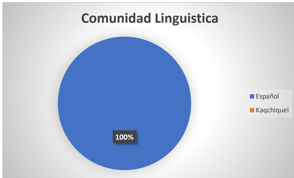
Grafica No. 2 Frecuencia Según Comunidad Lingüística