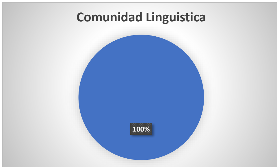
Grafica No. 2 Frecuencia Según Comunidad Lingüística