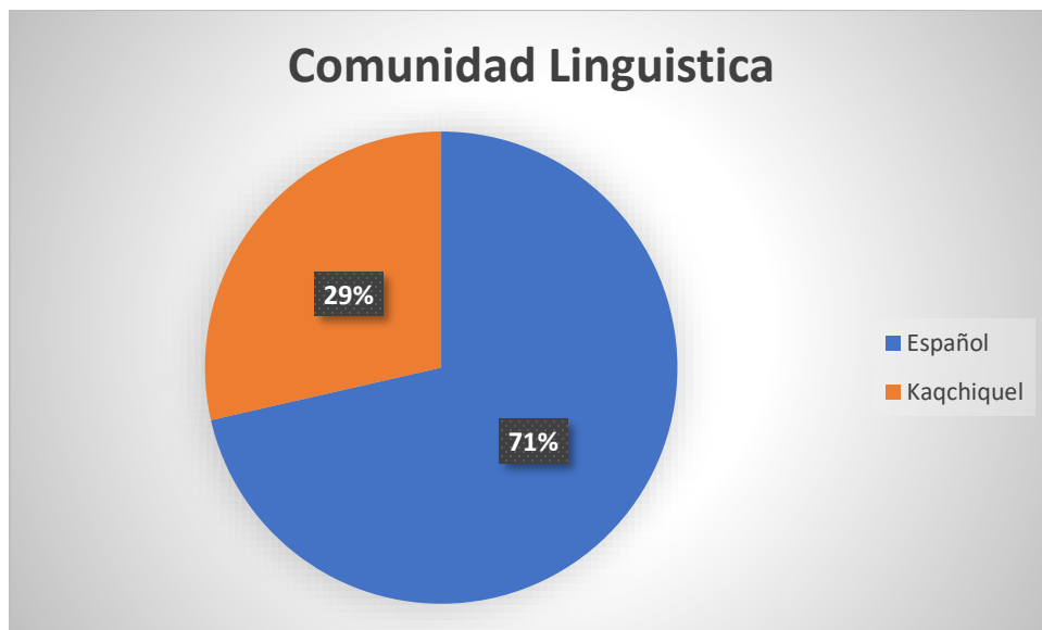
Grafica No. 2 Frecuencia Según Comunidad Lingüística